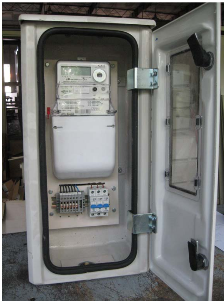
Slika 2. Registrator na vodu u pripadajućem ormanu za spoljašnju ugradnju

Na slici 2. je prikazan jedan registrator. Priključuje se na isti način kao i brojilo i strujni priključci obavezno se priključuju preko odgovarajućih obuhvatnih mernih transformatora X/1 A.